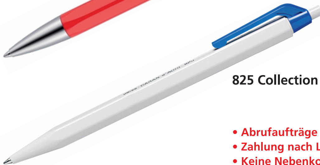
825 Collection Eco (ab 1000 Stück)*