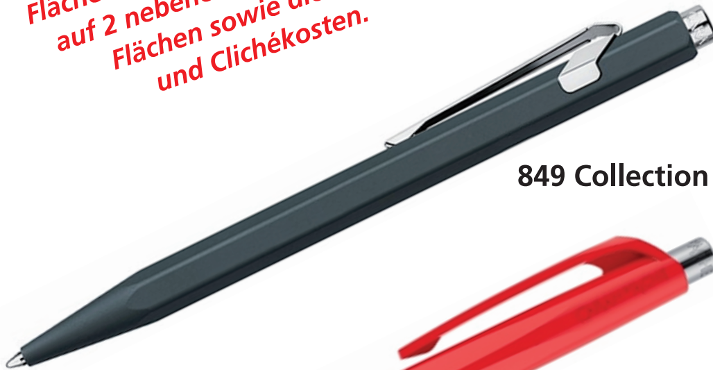
849 Collection Métal (ab 100 Stück)*